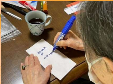
七夕のおねがいごと 一生懸命書いております。