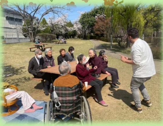
外出は楽しいですね(^^♪