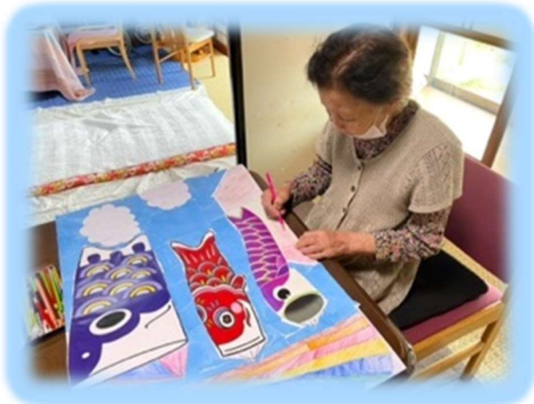
5月は大きいこいのぼりを作りました。