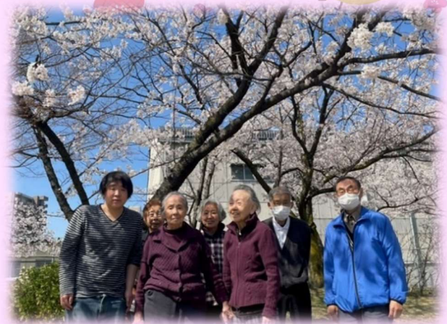
桜の下で記念撮影。いい顔です！