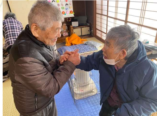
はじめましての挨拶。とても良い雰囲気でお話されています。