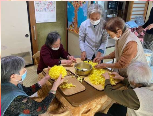
菊会に向けて、下ごしらえ。