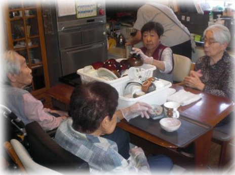
80歳から102歳のお仲間で、 会話が弾みます。