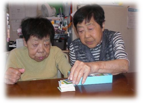
これからカルタ取りです。 一枚ずつ並べていきます。