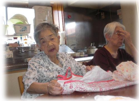
通所されると、タオルたたみやエプ ロンたたみで大忙し！！