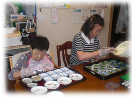
昼食の配膳。皆さん丁寧に盛り分け てくださいます。