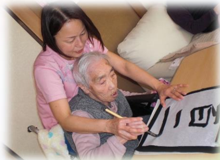
もうすぐ102歳のトヨコさん