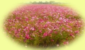
コスモス畑にて(新村)