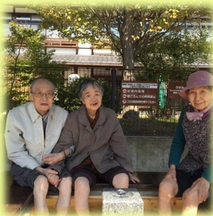
浅間温泉足湯にて